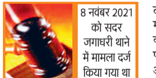
8 नवंबर 2021 को सदर जगाधरी थाने में मामला दर्ज किया गया था

पांच वर्षीय बालिका के साथ दुष्कर्म करने के मामले में अदालत ने 24 वर्षीय आरोपी को अंतिम सांस तक जेल में बंद रहने व एक लाख रुपये जुर्माना की सजा सुनाई है। यह सजा फास्ट ट्रैक कोर्ट ने सुनाई है। उक्त जानकारी जिला न्यायवादी धर्मचंद व जिला उपन्यायवादी जीके टंडन ने दी है। जानकारी के मुताबिक 8 नवंबर 2021 को सदर जगाधरी थाना एरिया के एक गांव निवासी महिला ने महिला थाना पुलिस को शिकायत दी थी कि उसके बेटे का शहर के सामान्य अस्पताल में उपचार चल रहा था। वह उसके पास गई थी। इसके बाद वह घर वापस लौटी तो उसकी पांच वर्षीय