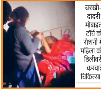
चरखी-दादरी। मोबाइल टार्च की रोशनी में महिला की डिलीवरी करवाते चिकित्स।

शुक्रवार रात चरखी दादरी के सामान्य अस्पताल में एक महिला ने मोबाइल टार्च की रोशनी में बच्चे को जन्म दिया। दरअसल डिलीवरी के दौरान अस्पताल परिसर के बिजली अचानक से गुल हो गई तथा जनरेटर भी तकनीकी खराबी के कारण नहीं चला। अस्पताल में पूरी तरह अंधेरा पसर गया। ऐसे में चिकित्सकों ने मोबाइल टार्च की रोशनी में डिलीवरी करवाई। गांव अटला निवासी एक महिला को प्रसव पीड़ा के कारण दादरी सामान्य अस्पताल में दाखिल करवाया गया था। महिला की डिलीवरी के दौरान अचानक अस्पताल परिसर की बिजली चली गई। इसके बाद कर्मचारियों ने जनरेटर को स्टार्ट करना चाहा, लेकिन तकनीकी खराबी के कारण वह नहीं चला। इसके बाद चिकित्सकों ने अपने अपने मोबाइल निकालकर टार्च चलाई। मोबाइल टार्च की रोशनी में ही महिला की डिलीवरी हुई तथा एक स्वस्थ बच्चे को जन्म दिया। महिला के परिजनों ने कहा कि सरकार सामान्य अस्पतालों में बेहतर चिकित्सा सुविधाओं का दावा करती है, लेकिन दादरी सामान्य अस्पताल में आज